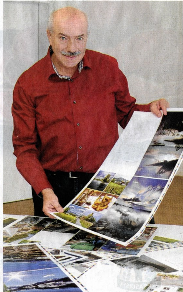
Axel Botts Buch «Wasserschwyz» zeigt mittels Fotografien und Porträts die Zusammenhänge des Wassermanagements im Kanton auf. Dazu zählt auch die Seepromenade Freienbach mit seiner reichen Vegetation.